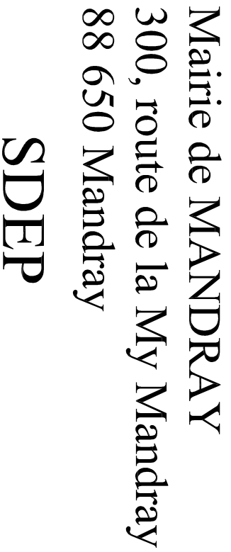
Schéma de Distribution de l'Eau Potable